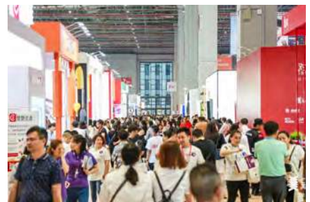
上海の第49回中国国際美博会