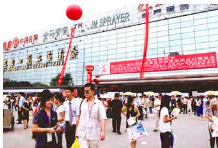
以前はカントンビューティーフェアとして知られていた