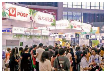
オーストラリアパビリオン