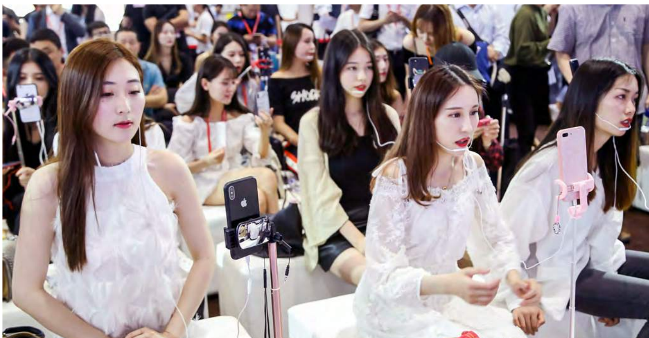
22人のKOLライブストリーミング、全世界で5,000万以上のアクセス量を持つ